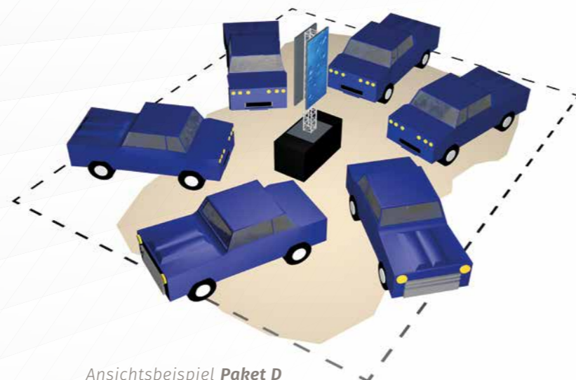
Ansichtsbeispiel Paket D z. B. 11 x 13,5 m

€ 380,- exkl. 20% USt. pro Sujet/Seite (1 x 2 Meter) Logos, animierte Infotexte, Slideshow beigestellter Bilder, eventuell Einbindung beigestellter Videos (formatabhängig)